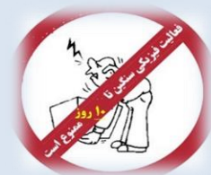
مراقبت بعد از جراحی بینی