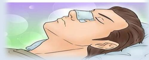
طرز خوابیدن بعد از عمل بینی